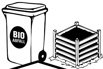
Biomüll oder Kompost: