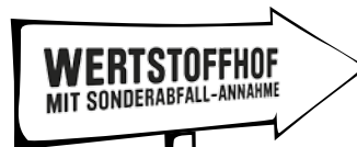
Schadstoffsammlung oder besondere Behälter: