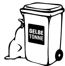
Wertstoffsack oder Wertstofftonne: